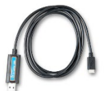
Interfaccia VE.Direct a USB