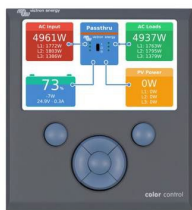
Color Control GX