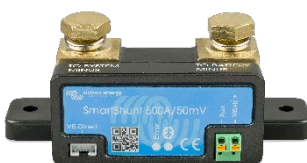
Rilevamento Bluetooth: SmartShunt