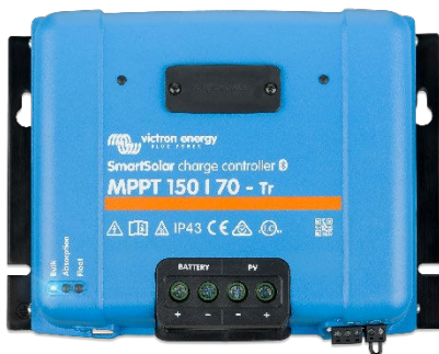
Regolatore di Carica SmartSolar MPPT 150/70-Tr senza display opzionale