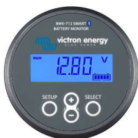
Rilevamento Bluetooth: Dispositivo di controllo della batteria Smart BMW-712