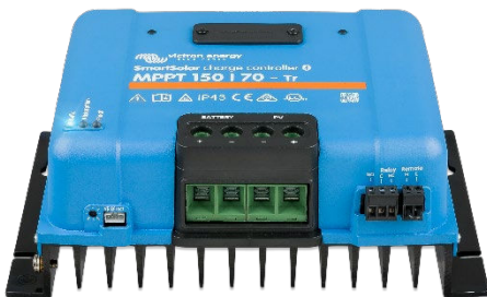
Regolatori di carica SmartSolar MPPT 150/70-Tr senza display