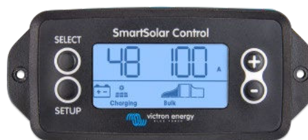
Display a spina SmartSolar

Si deve solo rimuovere il sigillo in gomma che protegge la spina sulla parte frontale del regolatore e inserire il display.