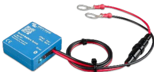
Rilevamento Bluetooth: Rilevatore Smart Battery